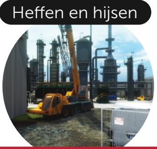
Gereedschappen en machines