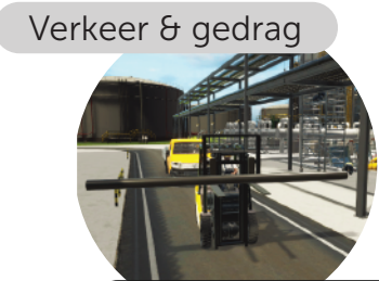
Verkeer & gedrag