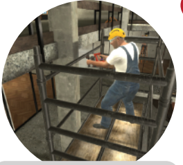
Werken op hoogte