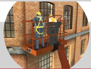
Schaarliften, verreikers en kranen